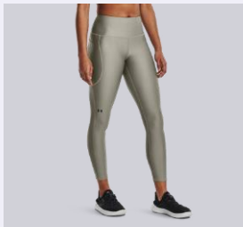
VIŠJI (HIGH RISE)