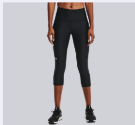
POD KOLENA (CAPRI)

Za nekatere modele ponujamo tudi ekstra podaljšane ali skrajšane dolžine. Ob črki, ki označuje klasično velikost, imajo podaljšane dolžine črko T (npr. MT), skrajšane pa črko S (npr. MS).