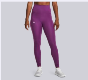
POLNA DOLŽINA (FULL LENGHT)