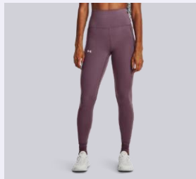
ULTRA VISOK (ULTRA-HIGH RISE)